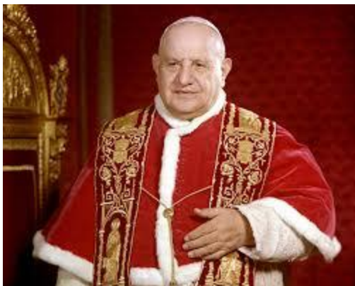
Popiežius Jonas XXIII