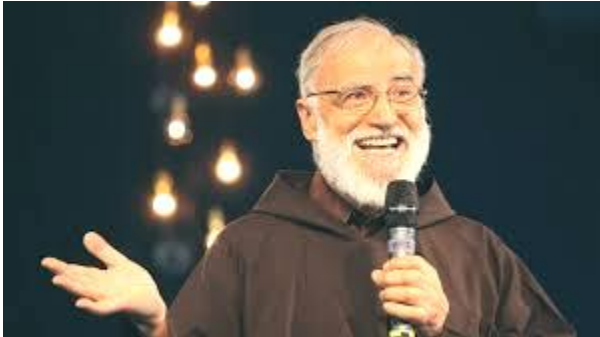
Tėvas Raniero Cantalamessam O.F.M.