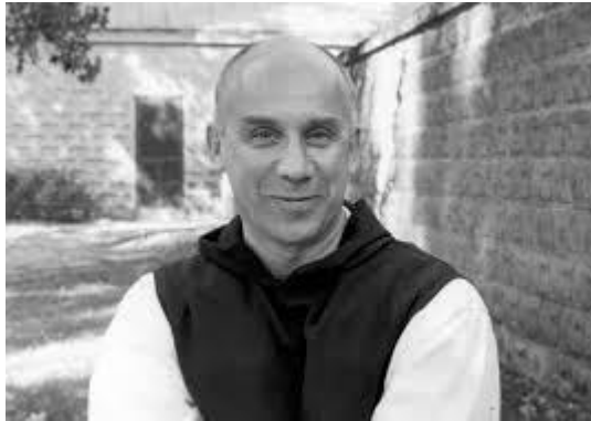
Thomas Merton (1915-1968)

Amerikonas katalikų rašytojas ir Trapistas vienuolis Our Lady of Gethsemane vienuolyne Kentucky